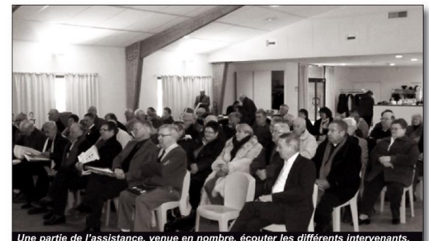
Une partie de l'assistance, venue en nombre, écouter les différents intervenants.